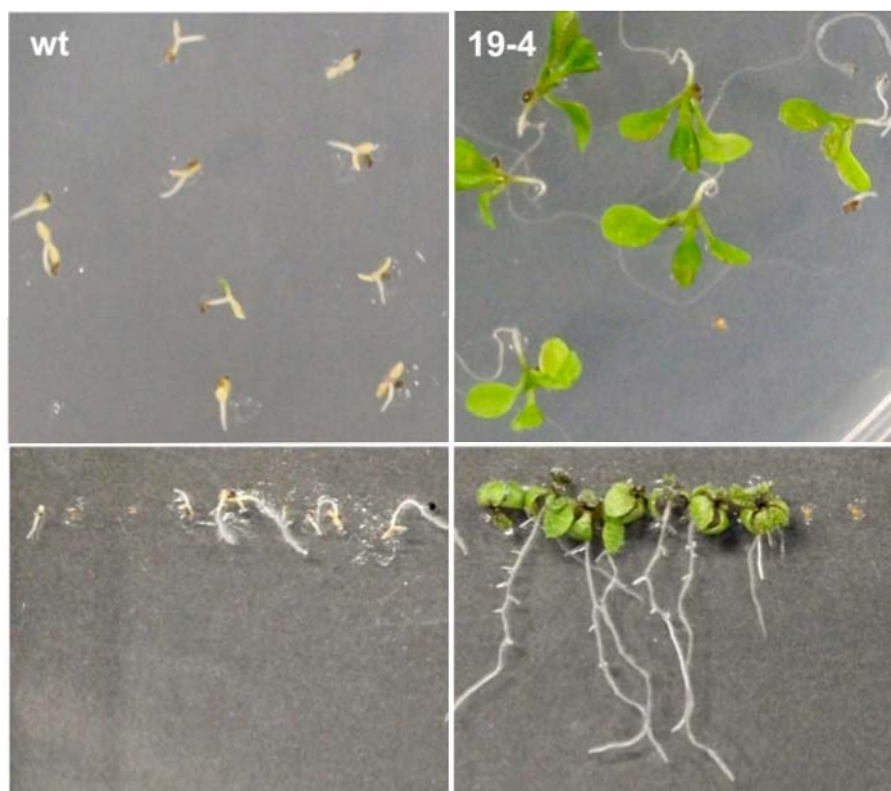
図2. ABA ストレス環境下における野生株（左）と ONSEN の転移によるストレス耐性獲得株（右） ABA を高濃度で含む培地に播種した野生株は発芽後生育が止まってしまうが、 ONSEN の挿入により ABA ストレス非感受性になった変異体では、生育することができる。

シロイヌナズナ pol IV 変異体に高温処理を行うと、次の世代で ONSEN の転移集団を得ることができる。この転移集団を用いてアブシシン酸ストレスに耐性を示す個体を探索した。